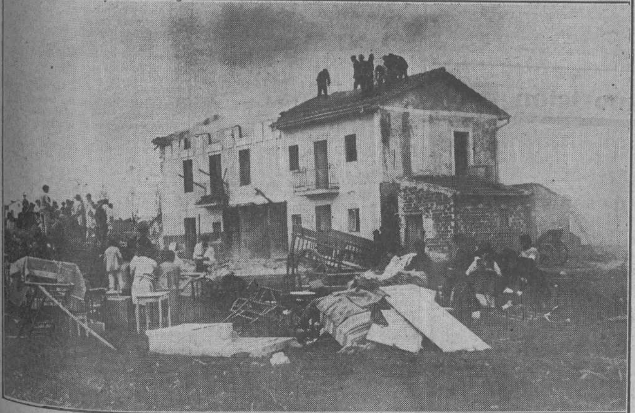
EL INCENDIO DE AYER EN LAS PRESAS.—Los bomberos trabajando para aislar la casa contigua de la en que se había declarado el fuego.—Otra nota del suceso.