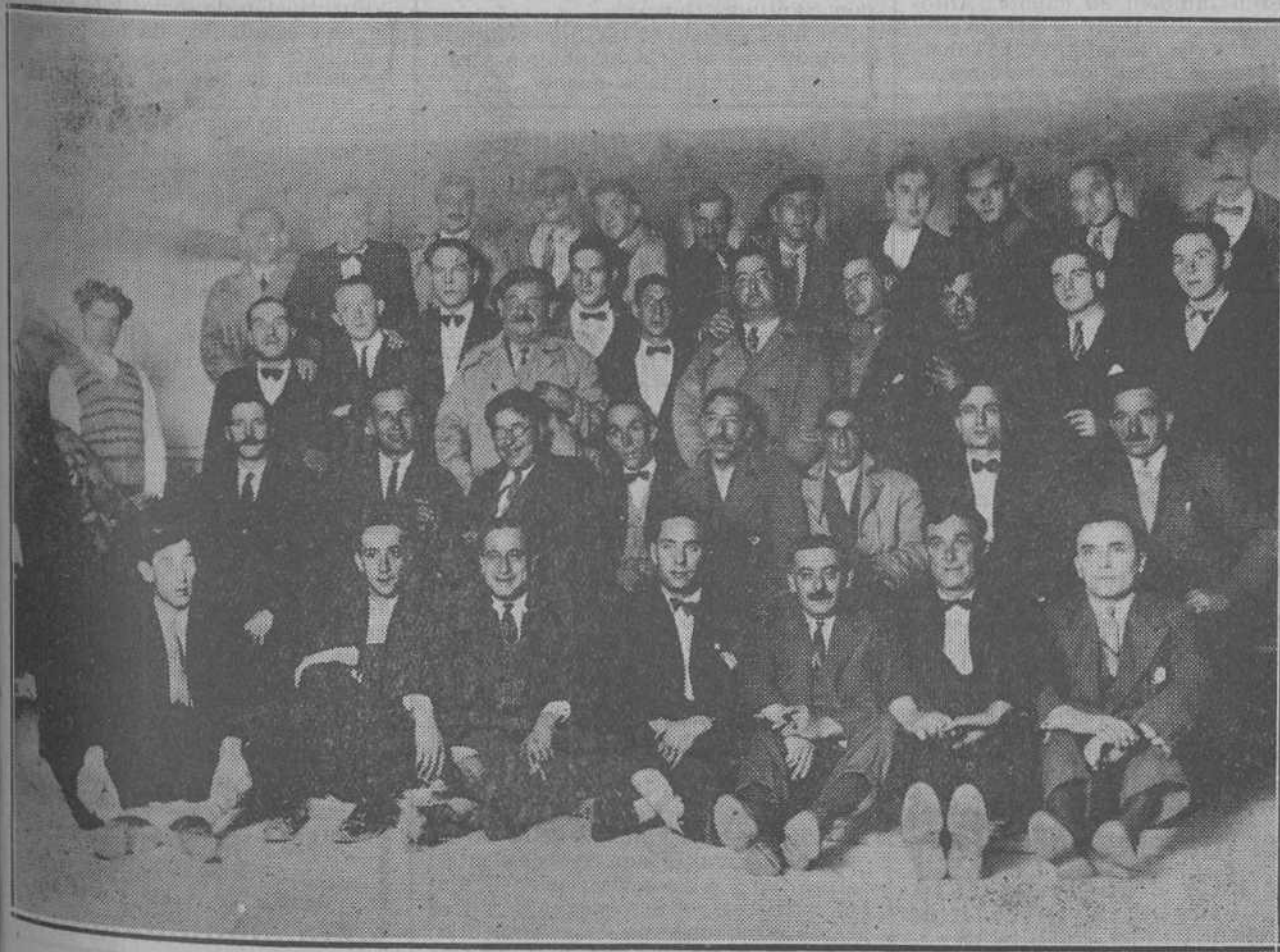
Concurrentes al banquete celebrado el viernes en «La Carmencita» por el Sindicato Marítimo de Camareros, Cocineros y Enfermeros.

"El frío era terrible—dice la princesa—. Al cruzar el Neva, volví la mirada hacia la fortaleza, que se perfilaba sombría y trágica. ¡Toda mi felicidad es-