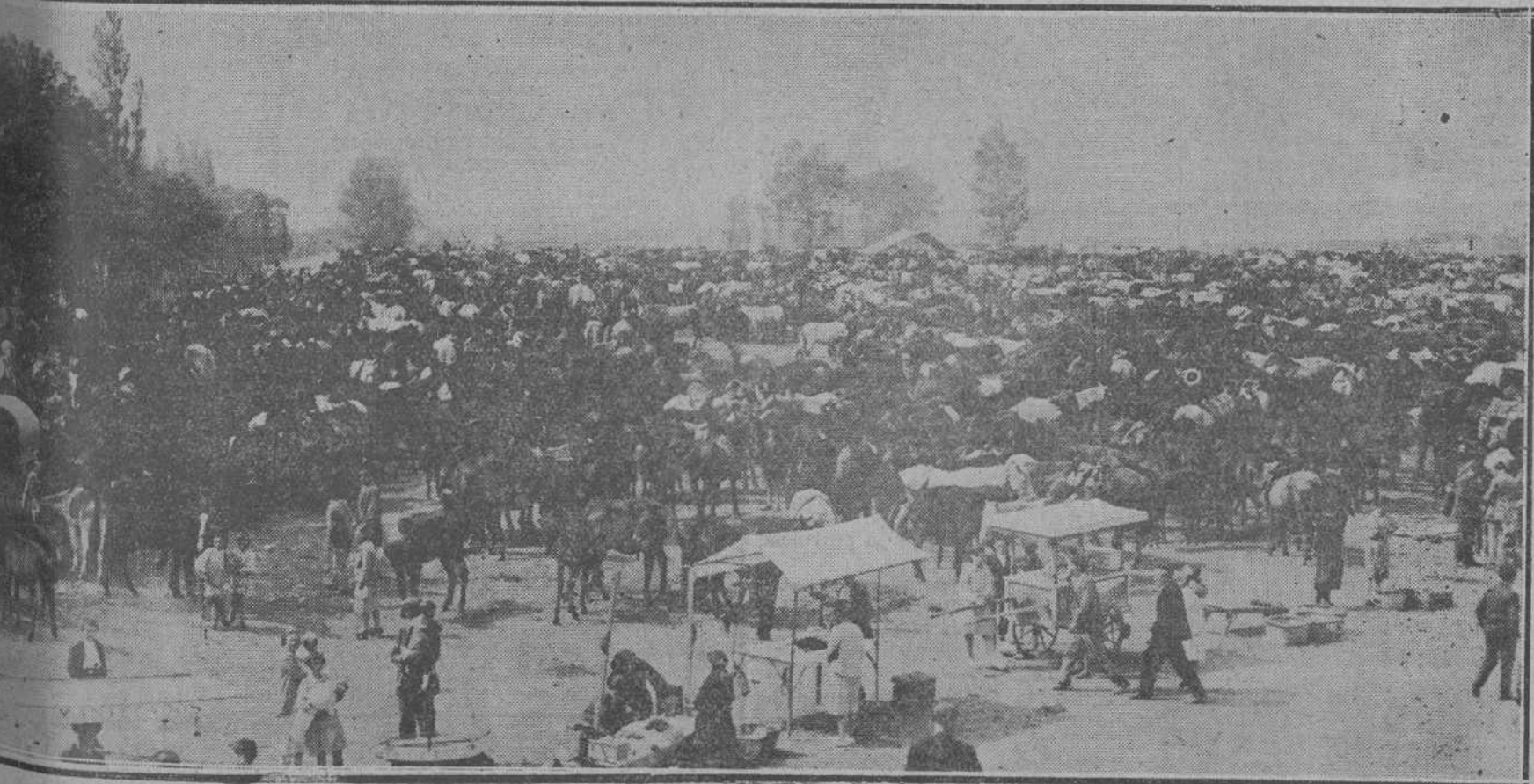
Ha comenzado en Reinosa la renombrada feria de San Mateo, una de las más importantes de España. La foto recoge un aspecto del fería.

Esto no puede ser, ni será. Ha- bremos de movernos, pues en el pensar de todos existe la certidum-