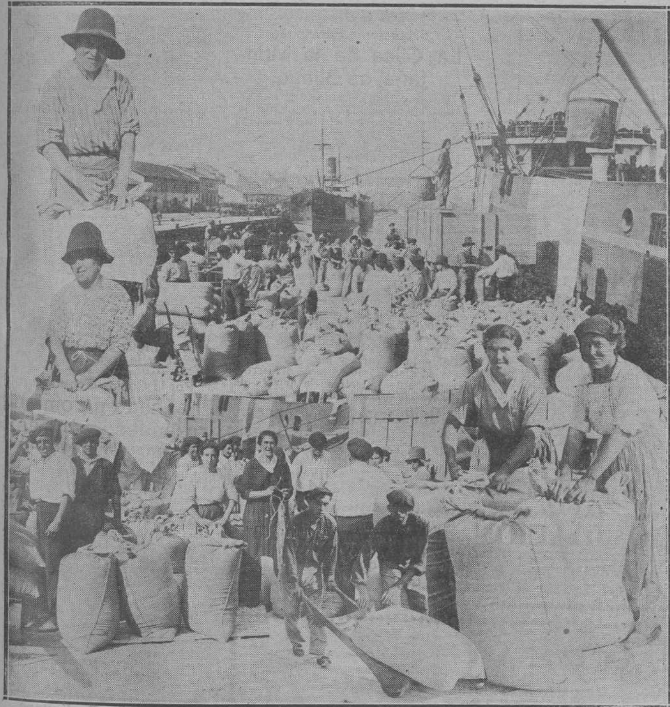
LOS TRABAJOS EN EL MUELLE.—A la llegada de un barco con cargamento de trigo, se ofrece en el puerto este curioso espectáculo. Un enjambre de mujeres y hombres realizan el envase con una diligencia a prueba del sol que cae como plomo sobre sus cabezas...

Cholo Bernáldez, diestro, ha parado el motor; el gasolino, gentilmente, ha atracado a una redonda boya blanca. Es la boya que, en medio de la canal, sirve para el amarre de los grandes vapores.