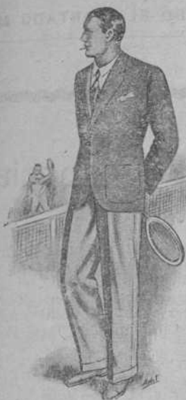
Americana y pantalón «Oxford» Gran novedad - Desde 29 pesetas.

y es garantía de Corte Elegante, Esmerada Confección y Positivo resultado