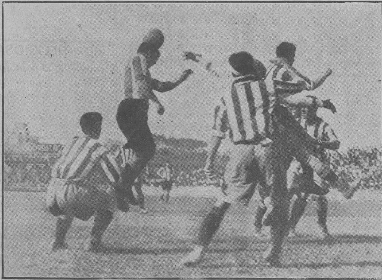
Un momento del partido Racing-Athletic, jugado el domingo en los Campos de Sport.