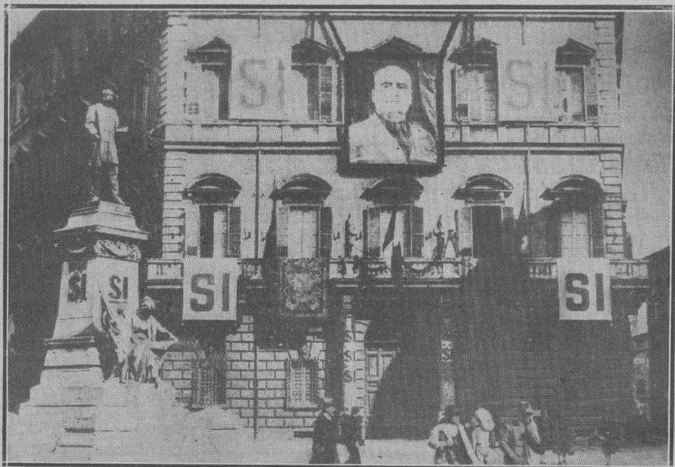
DE LAS RECIENTES ELECCIONES EN ITALIA.—Original manifiesto fascista, con el retrato de Mussolini, en la fachada de un palacio de Roma.

Hoy miércoles, a las siete de la tarde, tendrá lugar la apertura de una interesante exposición de obras escultóricas y dibujos de que es autor el joven artista señor Villalobos, pensionado por la excelentísima Diputación provincial para seguir sus estudios de ampliación artística en el extranjero.