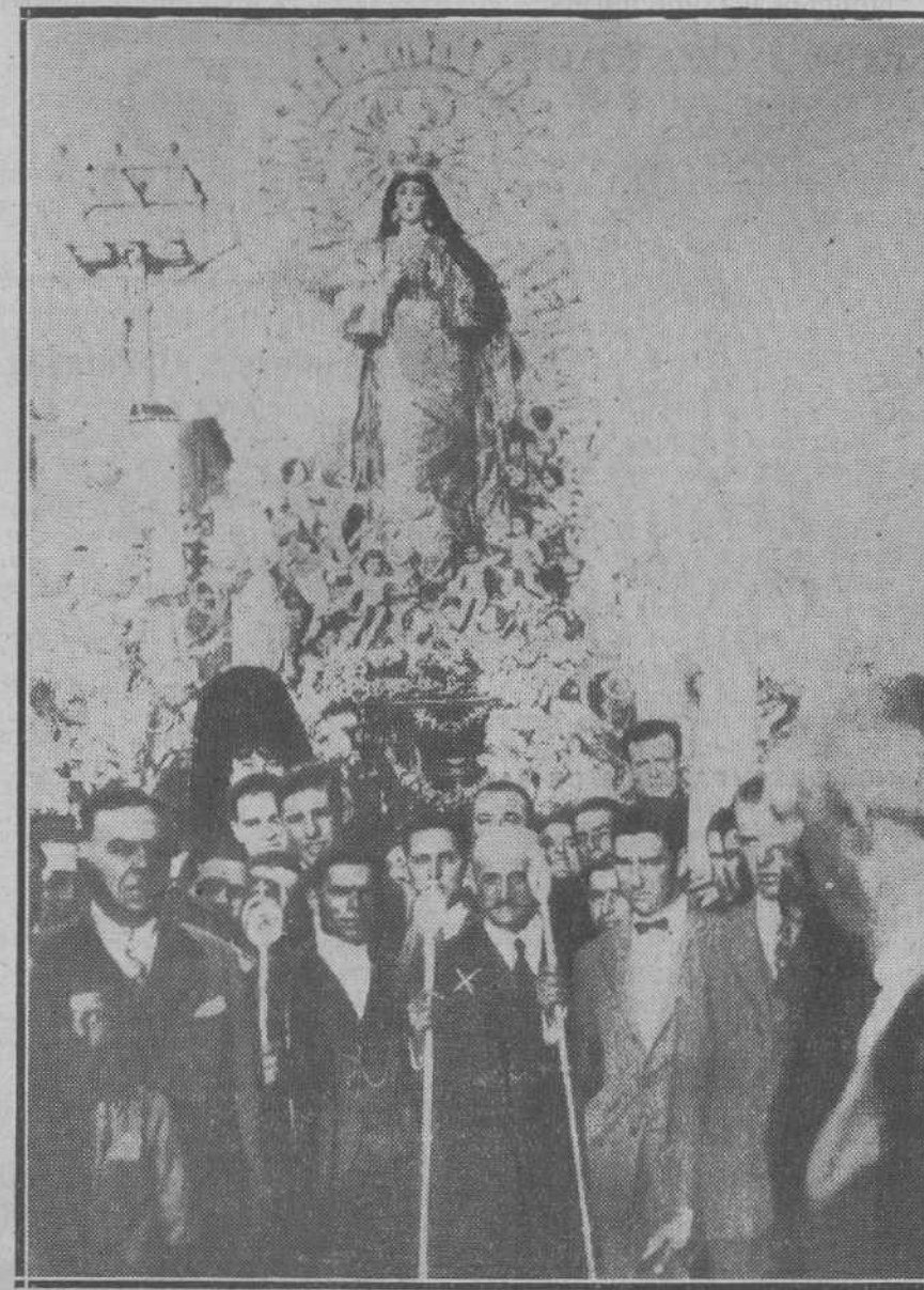
El conde de Romanones (X), presidiendo el domingo último la procesión de la Cofradía del Gran Poder y María Santísima, del pueblo de Castilleja de la Cues:a (Sevilla), de la cual ha sido nombrado hermano mayor.

LEA USTED EN NUESTRAS PLANAS DE INFORMACION TELEFONICA LAS ULTIMAS NOTICIAS DE ESPAÑA Y EL EXTRANJERO