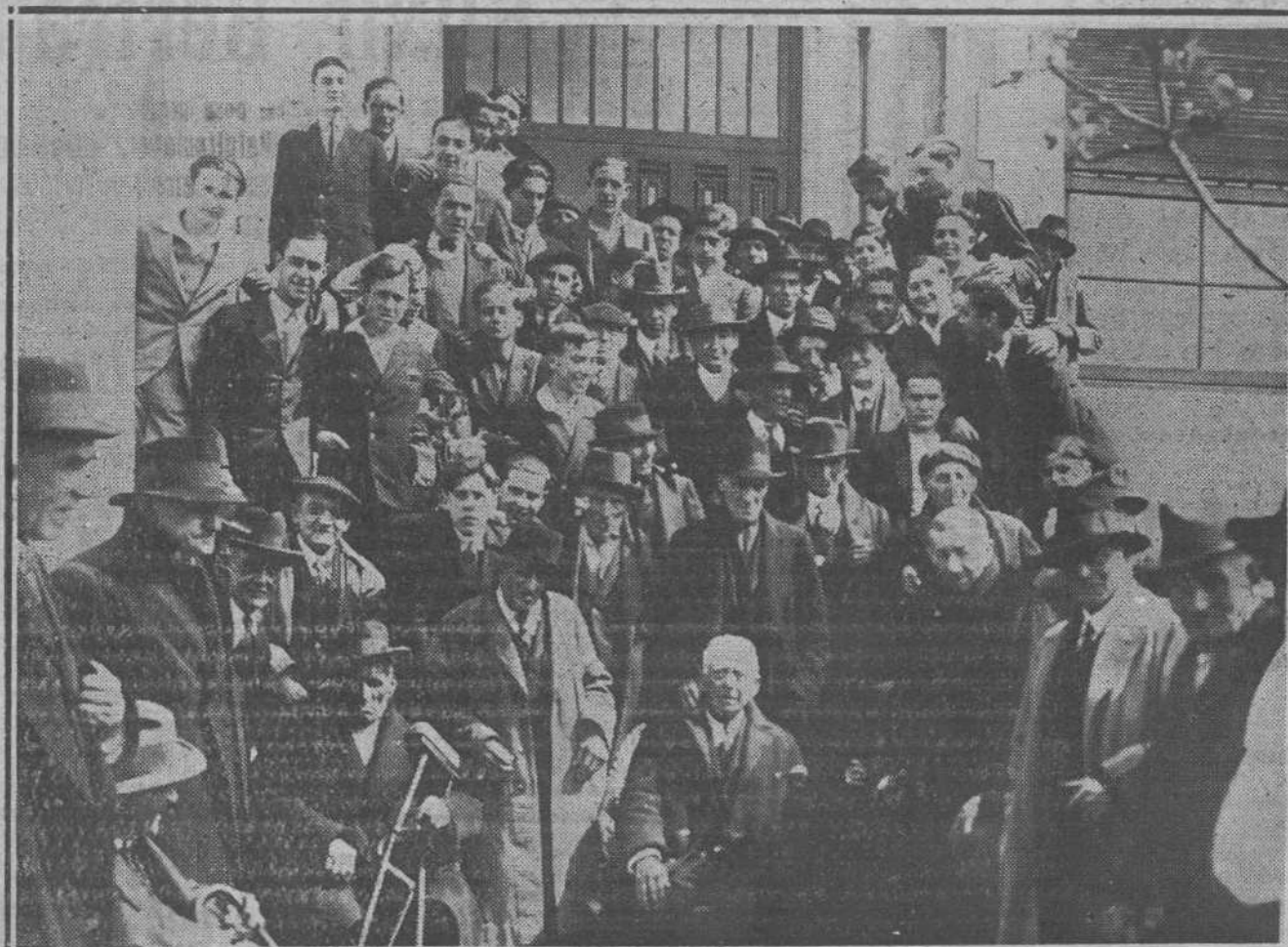
Grupo de asilados en las Hermanitas de los Pobres, con los jóvenes de la Congregación de San Esteban que sirvieron ayer una comida a los simpáticos viejecitos.

LEA USTED EN NUESTRAS PLANAS DE INFORMACION TELEFONICA LAS ULTIMAS NOTICIAS DE ESPAÑA Y EL EXTRANJERO