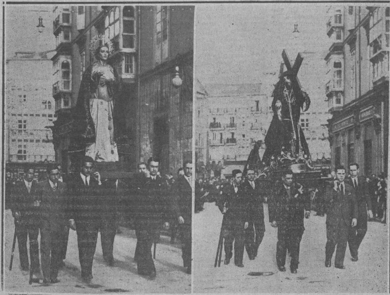
DEL JUEVES SANTO.— Dos notas del solemne desfile de las procesiones de ayer.

CONSOLACION. —Cambio de ambiente y cambio de público. Las familias representativas, en su peregrinación piadosa, no llegan aquí. Tampoco vienen las señoritas de mantilla y de peineta alta. En esta iglesia humilde están las cigarreras, las pescaderas, las vendedoras de la plaza. Devoción popular, tiene como oficiantes a las clases más típicas y más laboriosas. Se evoca a Pe-