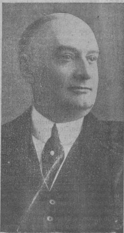
El ilustre ex Presidente de la República Argentina, don Marcelo T. de Alvear, que el sábado pasó por España con dirección a París. El señor Alvear ha dado una nueva prueba de su amor a España al iniciar la idea de la erección en Buenos Aires del monumento conmemorativo del vuelo de Franco.

¿Que todo esto se salva con el "quid divinum", con la inspiración? La mayoría de las gentes tienen una idea errónea del trabajo en el periódico. Con inspiración y, aun con poca cultura, se puede escribir una crónica magnífica. Lo reconocemos. Pero la crónica y el artículo, aunque muy interesantes, no lo son todo en el periódico. De cada diez periodistas que estén al servicio de una Empresa, solamente dos tendrán que hacer crónicas o artículos. El resto hará conferencias telefónicas, informaciones de centros públicos, extractos de prensa o el ajuste de las planas. ¿Para qué les servirán el "quid divinum" y la inspiración? En cambio, les será de gran utilidad saber taquígrafía, por ejemplo. Y el conocimiento del inglés o francés, no les estorbará tampoco. Así comprenderá usted, amiga Matilde, que para la mayoría de las funciones del periódico es más interesante la Escuela que la inspiración. Y a los mismos que tengan inspiración no les estorbará la Escuela. El que es un gran cronista, ¿dejará de serlo porque se le haga estudiar inglés? Y sabiendo inglés, o francés o alemán, no pasará por el bochorno porque pasan muchos periodistas actuales de no poder acercarse a un personaje extranjero sin un señor que les sirva de intérprete. Y no experimentará la contrariedad de no poder leer más que los periódicos y los libros escritos en su idioma. Hace cincuenta años podía prescindirse de todo eso. Hoy, con las exi-