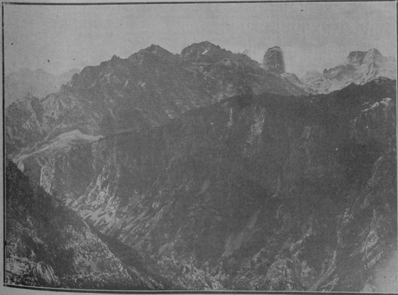
LA GRANDEZA DE LOS PICOS DE EUROPA.—La sinfonía de piedra de los Picos alcanza en estos paisajes que Alejandro captó con su máquina, sus momentos de mayor grandeza. El ánimo se siente sobrecogido ante este hacinamiento de gigantes bloques que forman el macizo entre Tresviso y Tielve. Al fondo, el Naranjo de Bulnes y Peña Vieja.

—Quiero volver a una mayor pureza de arte y de intención. ¿Hay mayor herejía que las tragedias de