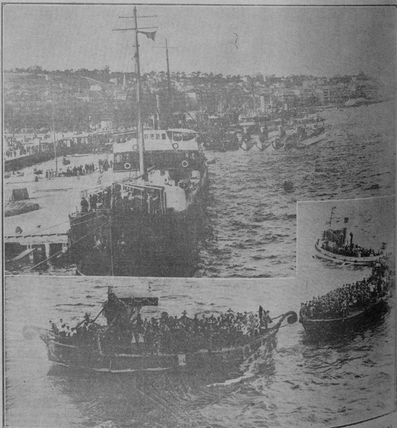
DE LA PROCESION DE AYER.—Las barcas engalanadas en su recorrido por la bahía.

Esta tarde, día 31, a las siete y media en el Ateneo de Santander, dará la conferencia del curso don Fernando Barrera, presidente de la Cámara Agrícola y alcalde de Santander, sobre el tema: "El porvenir agrícola y ganaderos de España".