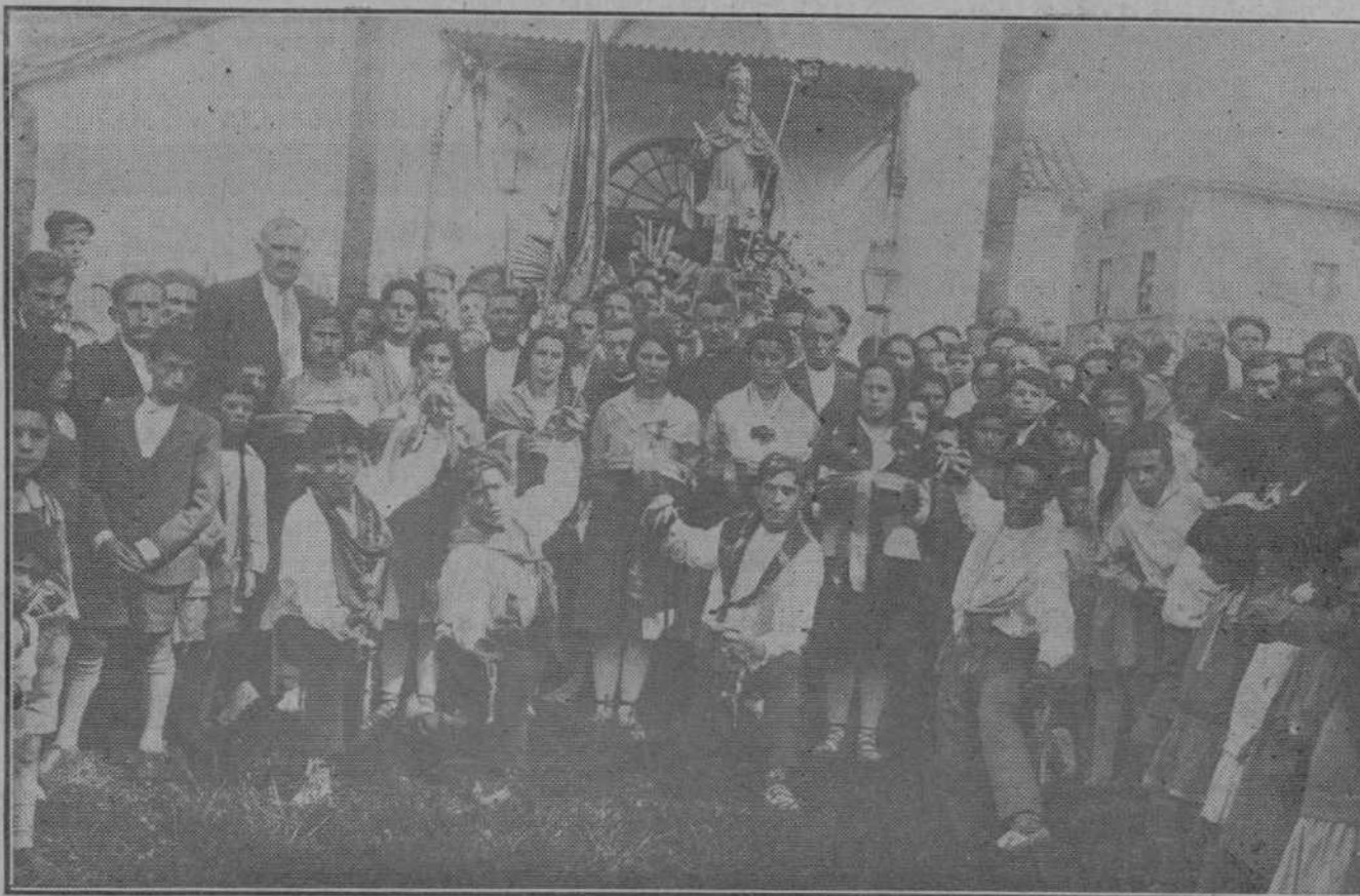
ALCEDA.—Bellas muchachas y simpáticos jóvenes que bailaron los clásicos "picayos" durante la procesión celebrada con motivo de la festividad de San Pedro.

Y no habiendo más asuntos, el señor presidente levanta la sesión.