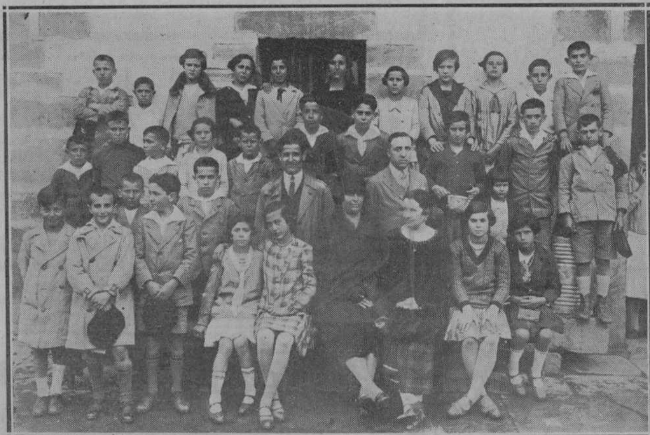
LAS EXCURSIONES ESCOLARES.—Grupo escolar de la Real Compañía Asturiana, de Reocín, que ha realizado una excursión por la provincia.

Santander, 1 de junio de 1925. LA ADMINISTRACION.