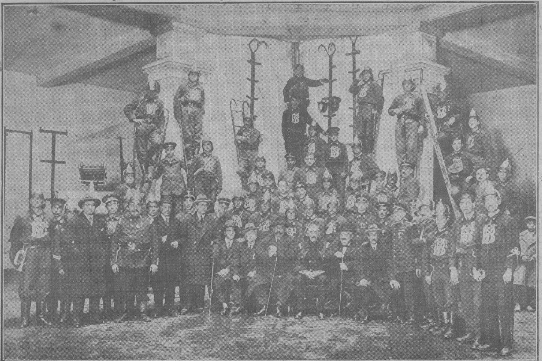
EL DOMINGO, EN EL PARQUE DE BOMBEROS VOLUNTARIOS.—Las autoridades con los jefes e individuos del Real Cuerpo de Bomberos Voluntarios, reunidos con motivo del acto de la imposición de medallas de oro, plata y cobre a algunos de los miembros de la institución.

Un anuncio es tanto más visible y eficaz cuanto menor es la plana del periódico donde se inserta.