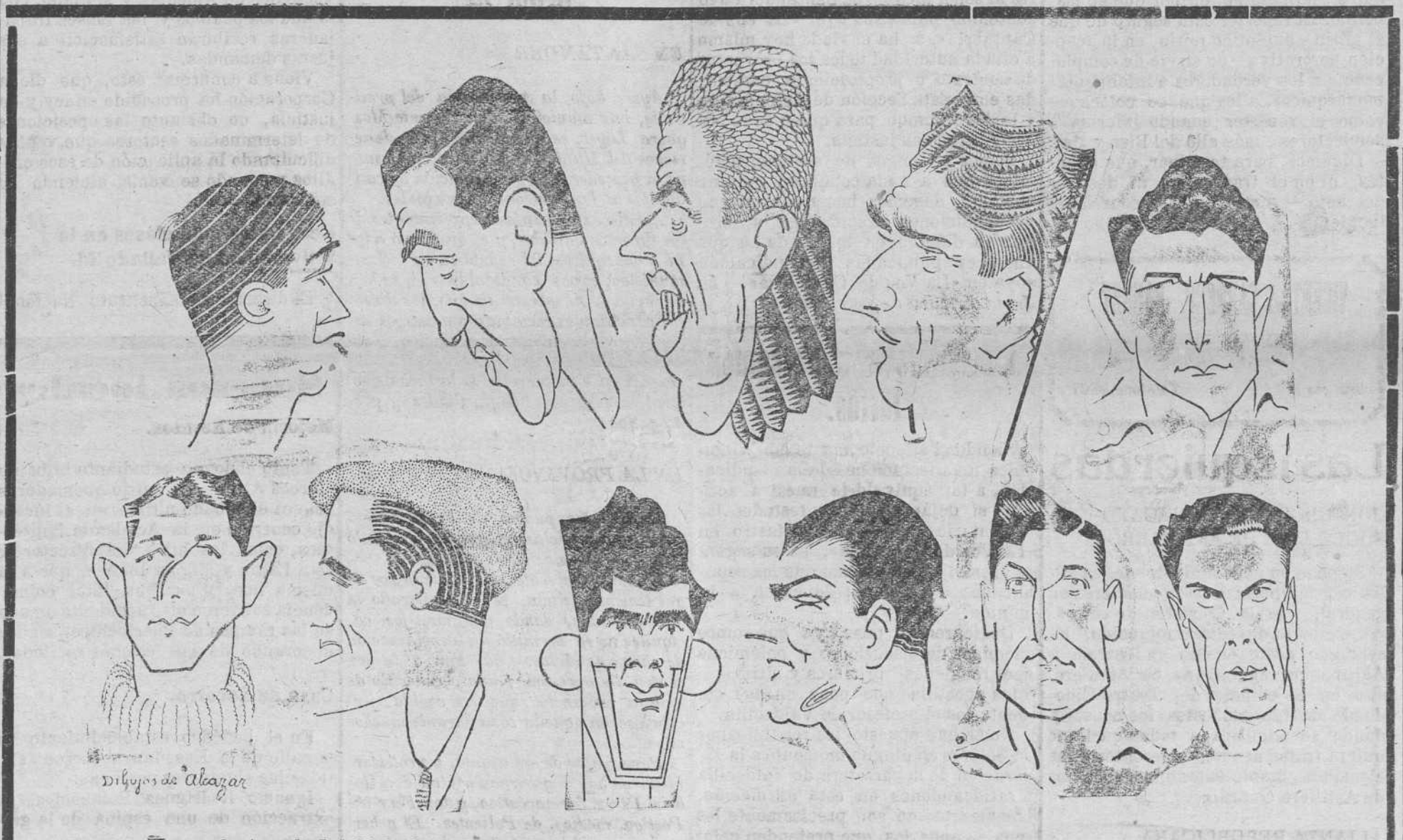
He aquí a través del lápiz de Alcazar a las once balas de Cantabria, a los once cachorros racinguistas

No ha sido el peor lugar, el que en estas jornadas nos ha deparado la suerte, en el caleidoscopio de colores de los clubs, desde el blanco absoluto del Real Madrid al rojo y negro del Arenas, los distintivos de nuestro Racing han parecido hasta amenazar en impresionantes superposición el rojo listado de nuestros vecinos atléticos. El milagro debe haberse integrado al entusiasmo y al juego de los jugadores que han alternado en la defensa del prestigio deportivo de Cantabria. A ellos todo el honor.