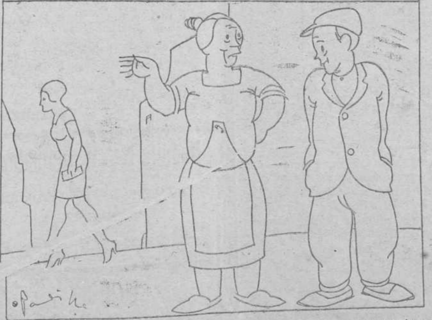
—No se dan a respetar, Tiburcio. Antes estábamos las mujeres mejor miradas que ahora. —¡Que te crees tu eso!

Benedicta de la Puerta, de 28 años, tuvo que ser asistida en el benéfico establecimiento de la calle de la Enseñanza por sufrir una contusión con hematoma en el párpado del ojo izquierdo y diversas contusiones en la espalda, producidas por sentimentales caricias de su esposo.