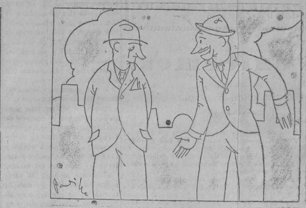
—Cuando el mes empieza en martes es buena suerte? —Según. A condición de que no empiece también en trece.

«Azorin» echa de menos a su sosias, en algunas ocasiones. Cuando «Azorin» ocupa su sillón de la Academia. Ese sillón de «Azorin» que está cimentado en «Charivarri». «Azorin» quiere un sillón para su sosias. «Azorin» le votará. «Azorin» quiere que el sosias vaya primero a la Academia que a Valde-Inclán. «Azorin» no se acuerda de Barroja. Barroja no se acuerda de «Azorin». Barroja no se acuerda de la Academia. Barroja escribe, escribe, con una bufanda cubriendo la calva; con unas zapatillas abrigando los pies; con un brasero que le tifica; con linimento de Sloan para curar el reum; con los de cincuenta muy avanzados. Así escribe Barroja. Así se olvida Barroja de «Azorin» y de la Academia. Y «Azorin» se