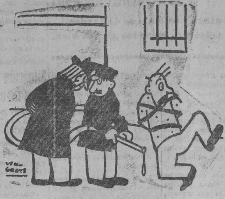
—Debe de estar completamente loco. Se figura que es Napoleón —¡Y tan loco! No sabe que Napoleón soy yo.

A esta conferencia podrán asistir, además de los alumnos del curso de extranjeros de dicha Sociedad de Menéndez y Pelayo, los alumnos del Colegio Mayor Universitario, Universidad de Liverpool y quien lo desee.