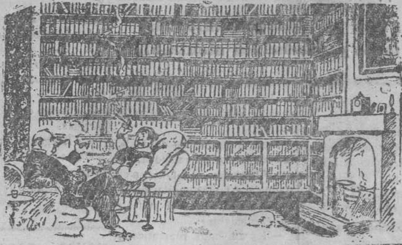
El nuevo rico.—Ahora que hemos comprado tantos libros, Sofía, siento no haber ido de pequeño al colegio para aprender a leer.