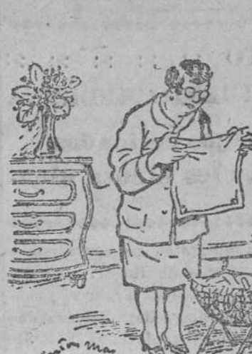
—Pero no ha bordado usted mis iniciales en las servilletas, como le dije? —Si, señora; las bordé en la primera, y puse «idem» en las otras.

Continúa lloviendo en la meseta central y el Sur de Francia.