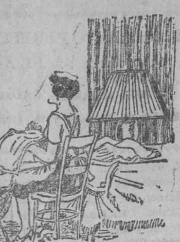
—Pero no ha bordado usted mis iniciales en las servilletas, como le dije? —Si, señora; las bordé en la primera, y puse «idem» en las otras.

Después la Comisión visitó la Diputación provincial, siendo recibida por el secretario de la Corporación, que hizo los honores a los visitantes, mostrándoles lo que de más notable encierra el bello y