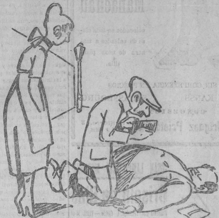
DESPUES DEL ASESINATO

El conductor del vehículo fué denunciado por la Benemérita.