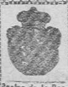
Castro de la Real Casa

Blanca, 11.-SANTANDER Teléf. 31-10 Casa en GIJON Corrida, 42