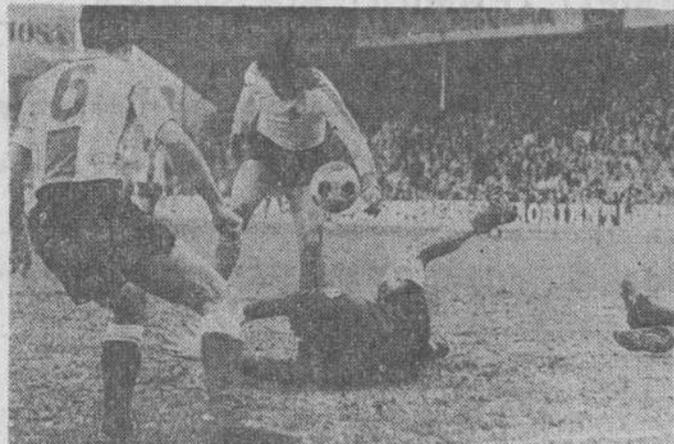
Jiménez desperdició esta clara ocasión de marcar, con Santoro a sus pies.

Calderón de la Barca, 14 - Teléfono 21-42-58