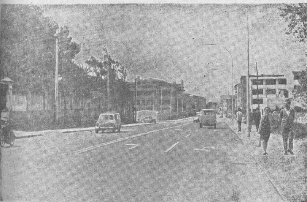
Entre las obras que serán inauguradas mañana, aniversario de la Liberación de Santander, merece destacarse el Paseo del General Dávila, que ha experimentado una transformación completa, y que es hoy una de las más bellas avenidas de la capital. He aquí un aspecto del nuevo Paseo.

Al cumplirse mañana, día 26, el XXXII aniversario de la Liberación de nuestra ciudad por el Ejército nacional, a las once de la mañana se celebrará una misa de acción de gracias en la Catedral, a la que asistirán las autoridades, invitándose a todos los sanderinos para que asistan a la misma. Después se procederá a la inauguración de la Avenida de Candina, Paseo del General Dávila y otras importantes obras que se han realizado últimamente en nuestra capital. Por último, habrá una recepción en el Palacio Municipal.