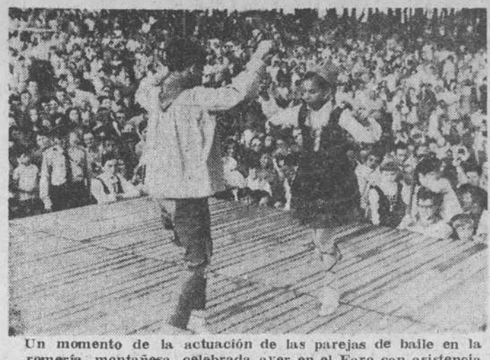
Un momento de la actuación de las parejas de baile en la romería montañesa celebrada ayer en el Faro con asistencia de miles de personas.