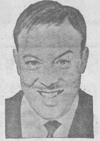
Con el ESTRENO de la obra más cómica de ALFONSO PASO!

GRAN COMPAÑIA DE COMEDIAS COMICAS ANTONIO GARISA