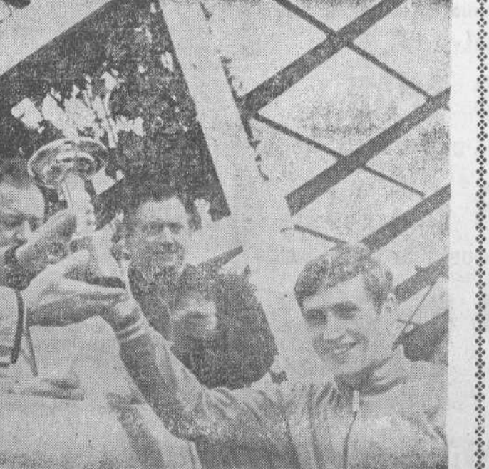
El cross de ayer en la Magdalena