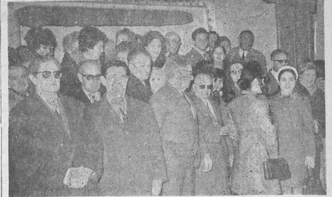
Ayer celebraron una reunión los cubanos residentes en nuestra capital, y a continuación tuvieron una comida de hermandad. En la foto, algunos de los asistentes.