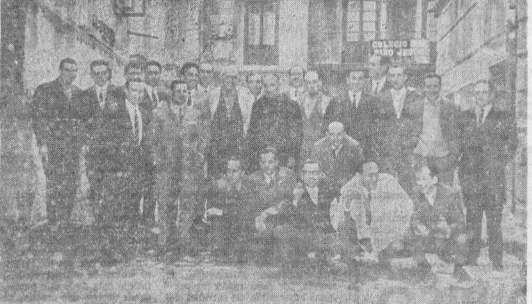
Profesores y alumnos, reunidos en fraternal camaradería en el 24º aniversario de su promoción.

Y en las bodas de plata de la promoción de aprendices de 1944 se repartieron muchos abrazos.