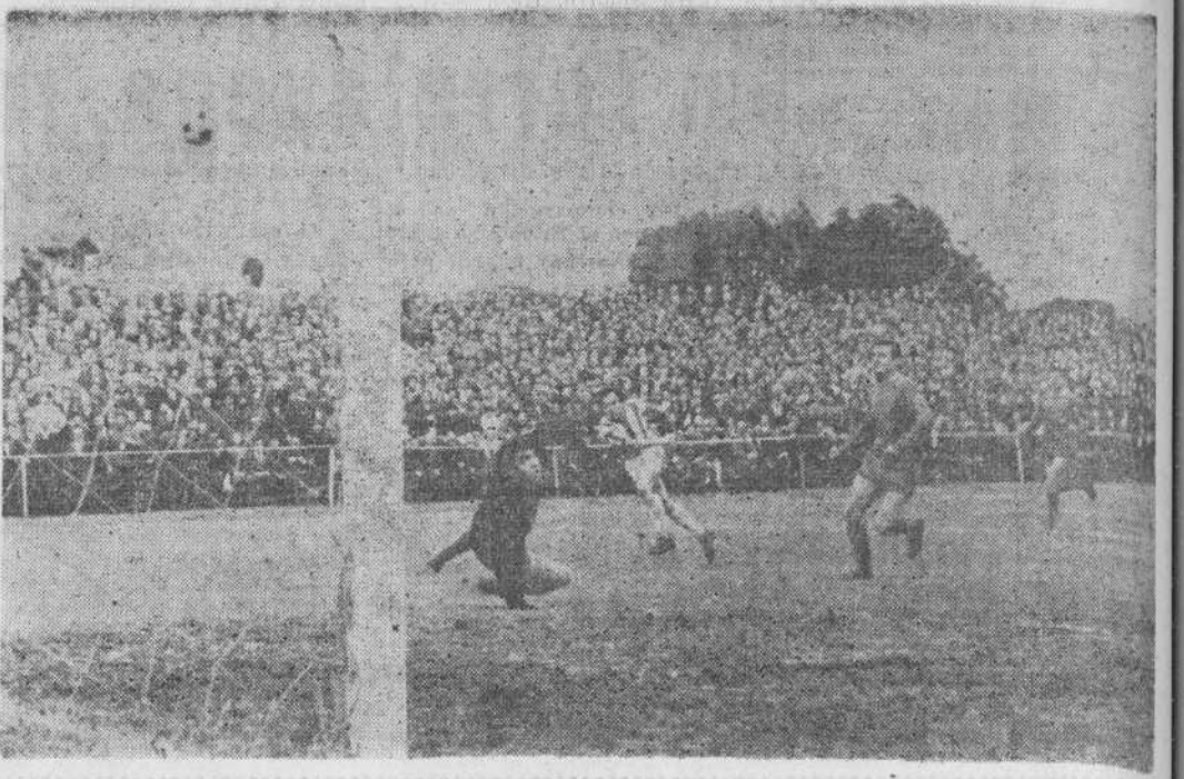
Aquí estuvo el tercer gol de la Gimnástica. Acero se internó, en el minuto nueve del segundo tiempo, y cuando lo más fácil era disparar al marco, Acero chutó demasiado alto, malogrando así un gol que se daba como seguro tan pronto como el balón llegó a los pies del delantero torrelaveguense.

Peró todo terminó aquí, incluso la esperanza, dado que salvo el período existente entre