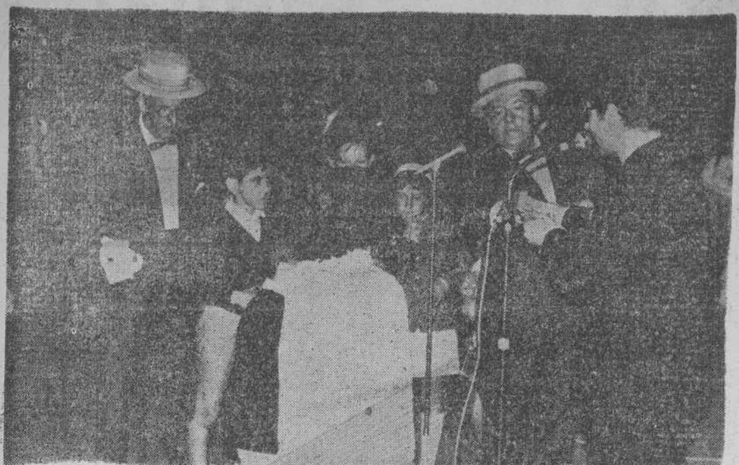
Entre los actos organizados ayer por la II Quincena Comercial, el celebrado en el Teatro Pereda. Gran Matinal Infantil, tuvo el aliciente de la intervención de dos populares figuras de Televisión Española, "Bolicho" y "Chapinete" que aparecen aquí, en la foto de Manuel Bustamante, con los pequeños que participaron en el sorteo de regalos. Participaron también payasos, ilusionistas y conjuntos infantiles.