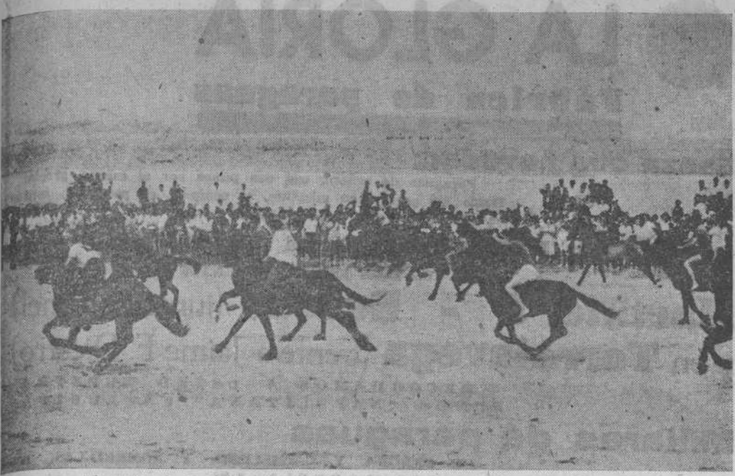
Momento de la salida del Derby, celebrado ayer en la playa de Loredo.