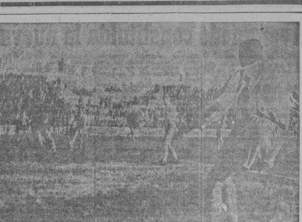
En una inteligente jugada, Duró lanzó fuerte tiro, que intercepta muy bien Varela, saltando la pelota a córner.—Foto IRUNA, hijo.