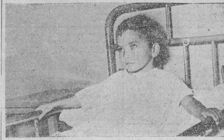
Este niño, con carita triste, acaba de ingresar en el Sanatorio de Santa Clotilde.

Estábamos en los Campos de Sport. Pálidas aun unos minutos para que comenzara el encuentro entre el Racing y el Jaén. Y de repente oímos un ¡ay! repetido por muchas gargantas. Un hermano de San Juan de Dios, con la preciosa carga de un niño lisado a cuestas, había perdido pie en una de las tribunas, cayéndose y dándose un trasluzo.