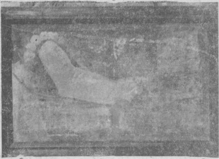
Sor Angela de San Buenaventura, la monja escritora

¡Notable contraste con las memorias de otras religiosas de la época, que constantemente padecían imaginaciones pavorosas de infernos poblados de una fauna que semeja la del Bosco! Desviación de la piedad entera del siglo XVI, en esta época de Felipe III y de Felipe IV, milagrosa y tan eficientemente a los retratos.