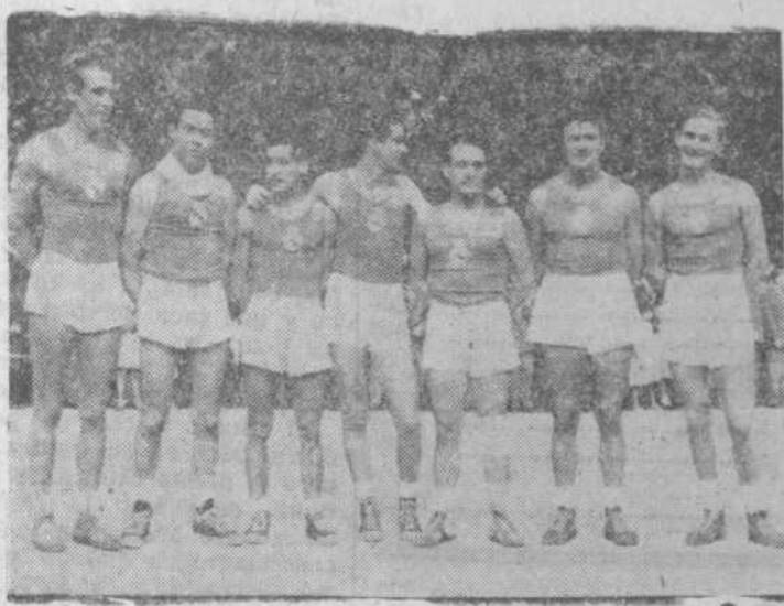
Equipo de baloncesto del Real Madrid

El domingo, según estaba anunciado, se jugó en el campo de la Alameda, el partido Real Madrid-Selección salmantina.