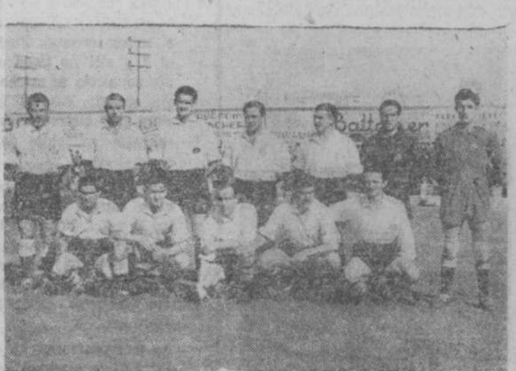
El equipo de la Unión Deportiva Salamancana, que el domingo viajó al Alcoyano por 4-3

Madrid.—Hecho el escrutinio de las apuestas mutuas benéficas del pasado domingo, han resultado premiados dos boletos de Madrid y Zamora, que acertaron doce resultados exactos y a quienes corresponden 32.889,45 pesetas a cada uno. Otros once boletos han acertado once resultados y les corresponde un dividendo de 5.481,55 pesetas a cada uno (Lugui).