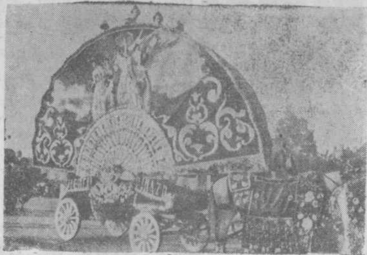
La tradicional feria valenciana terminó, como siempre, con una gran batalla de flores. He aquí la carroza «Valencia», galardonada con el primer premio