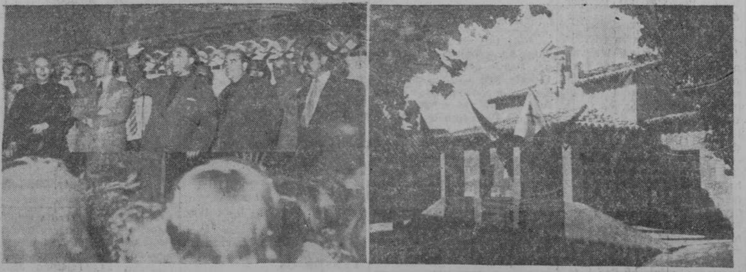
El pasado jueves se clausuró brillantemente el ciclo de inauguraciones de obras municipales para conmemorar el XVII aniversario del Movimiento Nacional. A la izquierda aparece el gobernador civil de la provincia, señor Taboada García, dirigiendo la palabra al vaciando de Santiago de la Puebla; la otra fotografía corresponde al nuevo edificio para Casa Consistorial en el pueblo de Cabrerizos