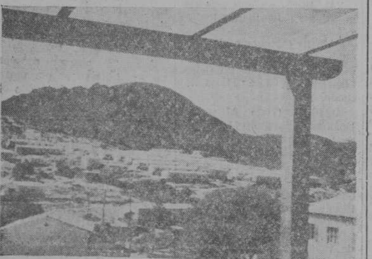
El poblado donde residen los cientos de obreros con sus familias