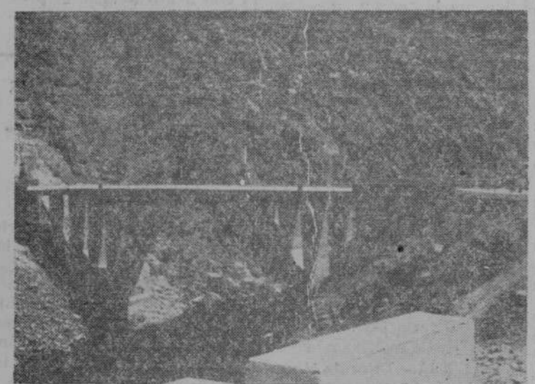
El puente, en la carretera desde Hinojosa, "frontera" del salto