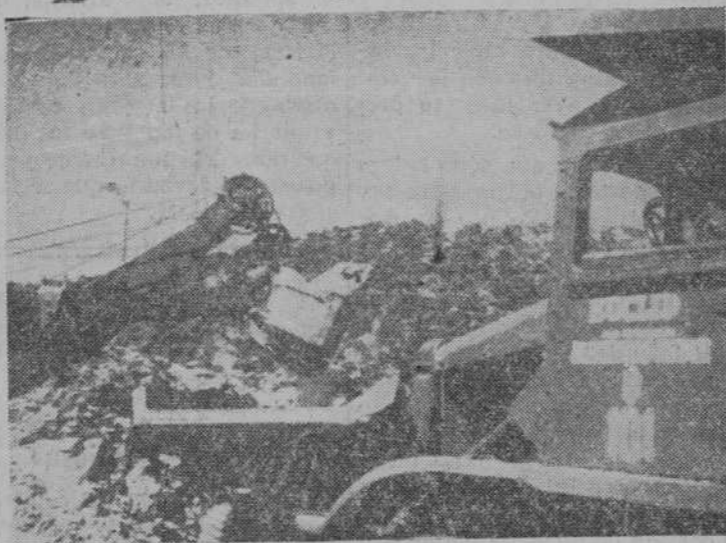
Los "monstruos" penetran en las entrañas de las montañas

Tejidos - Confecciones - Géneros de punto - Ventas Mayor y Detail POZO AMARILLO, 7 y 18 SALAMANCA