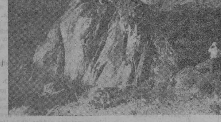
«El picón de Felipe». En este lugar está proyectada la presa del pantano de Aldeadávila

—Desde luego — contestamos —, esa es nuestra intención. —Pues, entonces, es necesario aprovechar la tarde. Y mientras el señor González Martín, va en busca de un guía, esperamos junto al coche. Gombau está un poco receloso y se dirige a una linda jovencita que nos contempla curiosa: