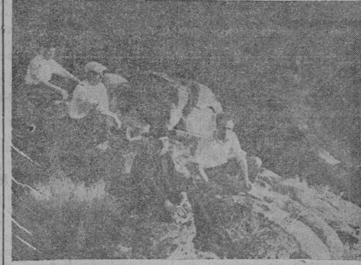
Abajo el Duero, que parece un regatillo

Es necesario volver. Las sombras misteriosas que siempre envuelven el fondo del cañón del río, se han ido ampliando