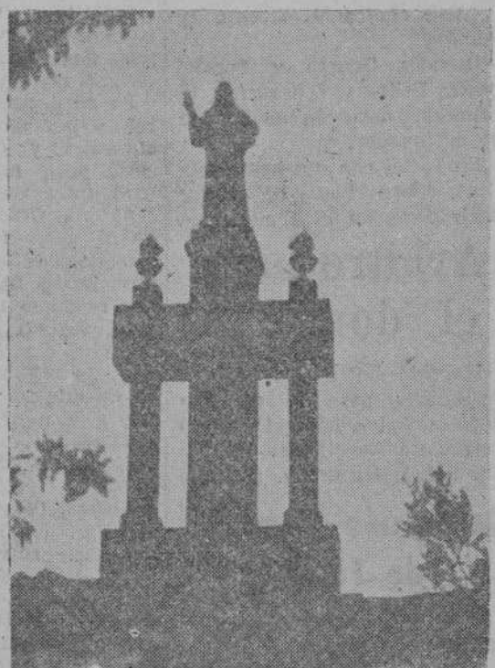
La ermita romana en el teso de San Pedro.