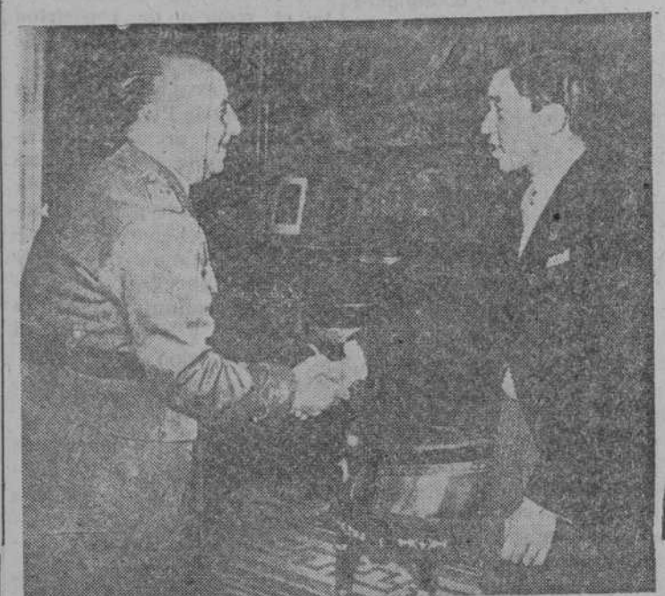
S. E. el jefe del Estado estrecha la mano al príncipe Akihito al recibirle en audiencia el pasado viernes.

El heredero del trono japonés visitó ayer el Museo del Prado