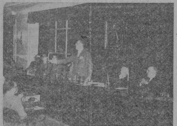
El subsecretario de Trabajo, señor Ruiz Jarabo, pronunciando un discurso en el acto conmemorativo de las bodas de plata de la Confederación de Cajas de Ahorro Benéficas.