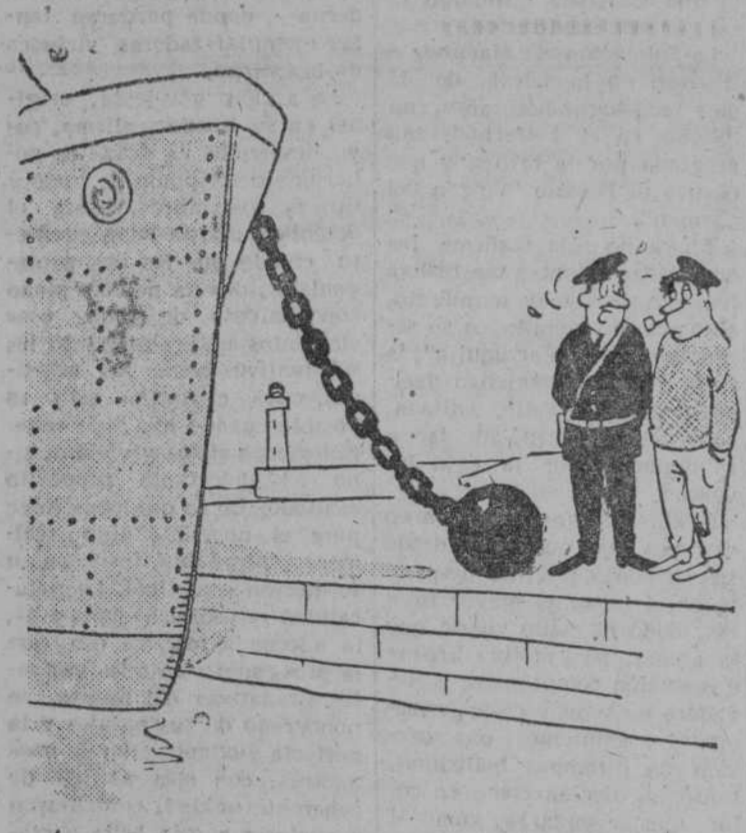
—Es el barco que hace el servicio del penal.