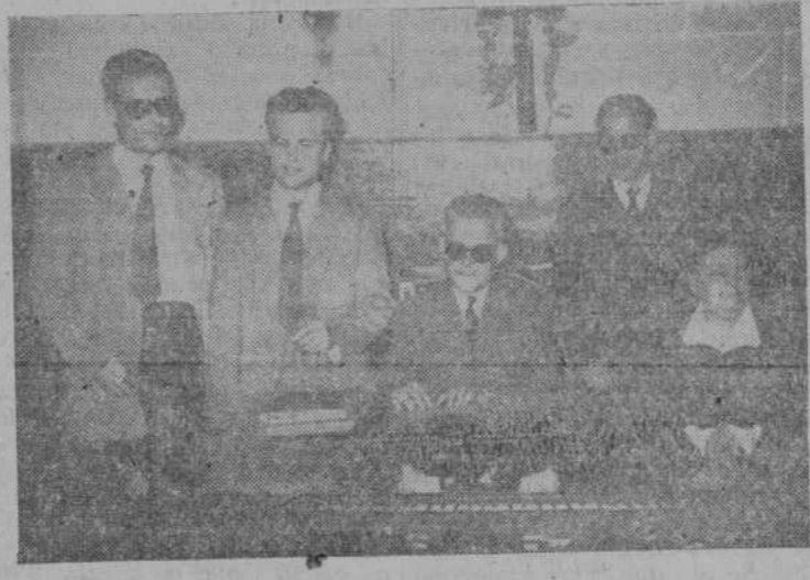
Los administrativos de la Delegación salmantina rodean al jefe de la misma para presentarse a los lectores de EL ADELANTO

Esta Obra, tan maravillosa y ejemplar en su infatigable labor, ha conseguido el llevar la paz, la tranquilidad y la confianza a muchos hogares. Hoy la población de ciegos de España puede vivir con la más absoluta de las seguridades de saberse protegido y no abandonado a su propio sino. Sabe que con su trabajo se ha redimido de mendigar una limosna y a la vez que sus hijos—si en el peor de los ca-