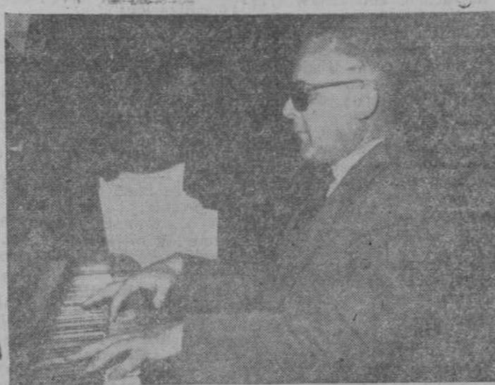
El delegado provincial de la Organización interpretó para nosotros, por cierto magníficamente, el "Claro de Luna", de Beethoven

Acoge la Organización en nuestra ciudad a ochenta y seis ciegos, que por medio del cupón reciben el cuarenta por ciento de las diez mil pesetas, cantidad media diaria de venta. De esa cantidad se distribuye para atenciones administrativas, imprenta, becas de estudio, etc., un doce y medio por ciento, y el cuarenta y