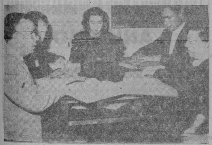
También los ciegos aprenden lectura y mecanografía conjuntamente, como se manifiesta en esta fotografía

ELECTRA DE SALAMANCA, S. A. Especies, 2 - Teléfono 3800 SALAMANCA