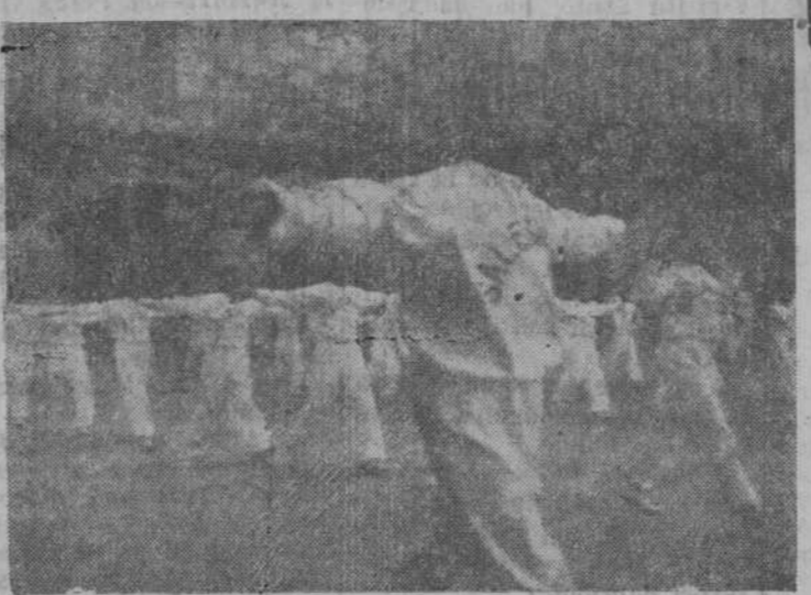
Una de las momentos de la exhibición deportiva del domingo en el Colegio de María Auxiliadora