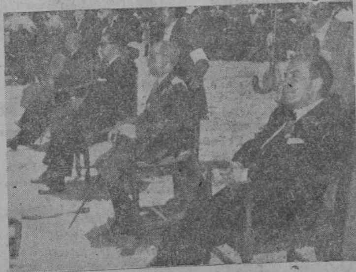
Los gobernadores civil y militar, presidente de la Diputación y autoridades locales, durante el acto de la mañana del domingo.

La misa se cantó por todos los asistentes, resultando algo prodigioso e impresionante. La ordenación y consagra-