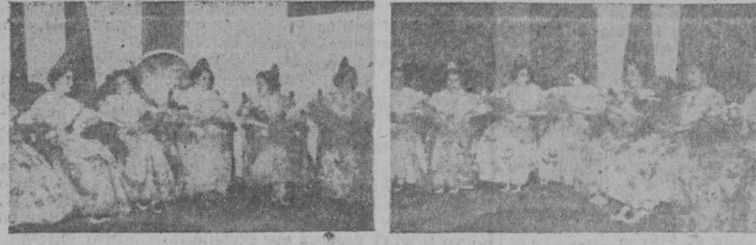
La corte de honor, con la madrina de la fiesta celebrada ayer por la colonia valenciana