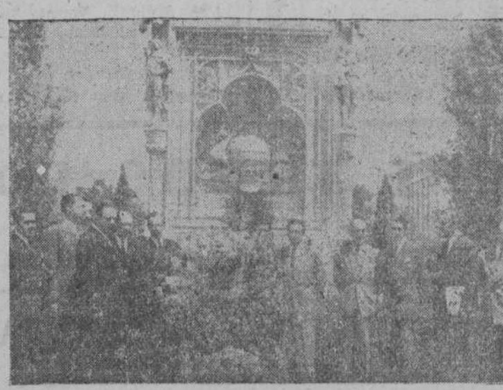
Miembros de la Embajada de Chile y estudiantes, en el momento de depositar una corona de flores ante el monumento a Colón