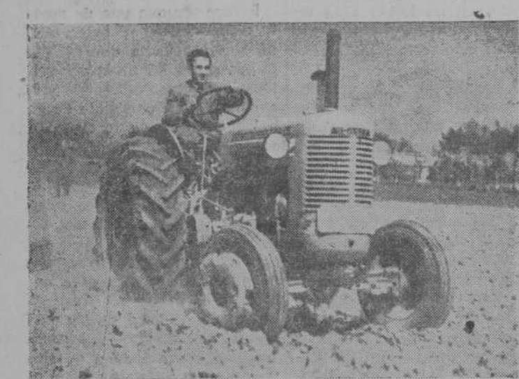
Uno de los tractoristas durante las pruebas celebradas en La Serna.

Fueron numerosas las personas que acudieron a presenciar estas pruebas, para la que se inscribieron, tomando parte en ellas, los siguientes tractoristas: