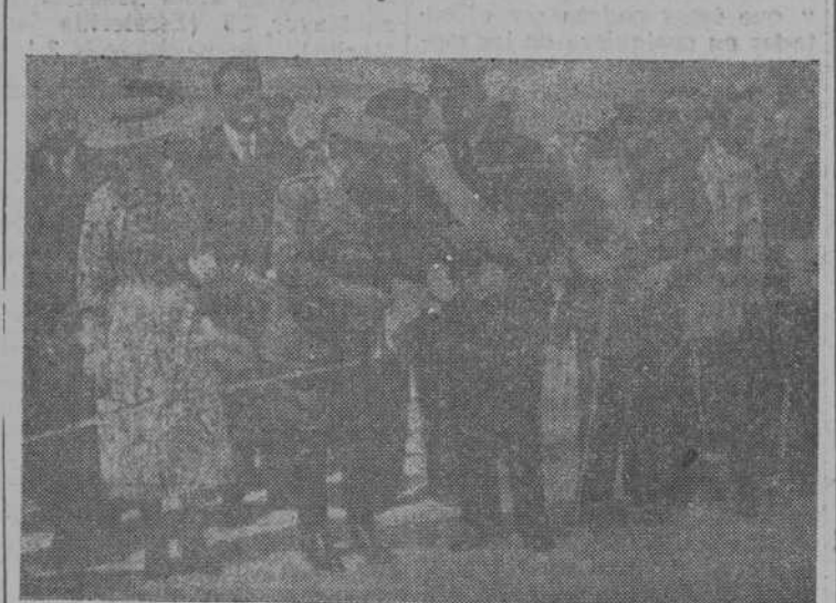
S. E. el Jefe del Estado, Generalísimo Franco, cortando la cinta para la inauguración del nuevo puente sobre el Guadaluquivir, en Córdoba.