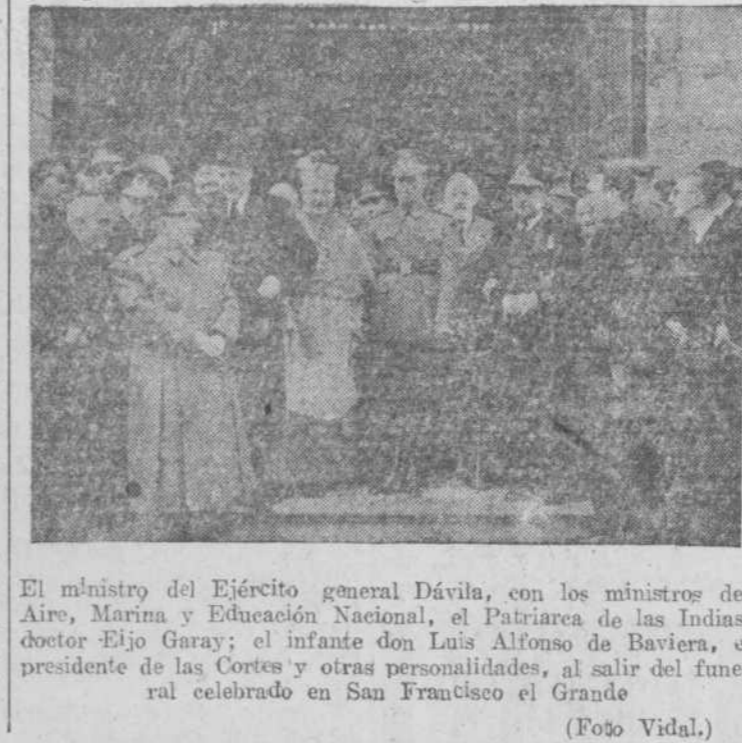
El ministro del Ejército general Dávila, con los ministros del Aire, Marina y Educación Nacional, el Patriarca de las Indias, doctor Eljo Garay; el infante don Luis Alfonso de Baviera, el presidente de las Cortes y otras personalidades, al salir del funeral celebrado en San Francisco el Grande