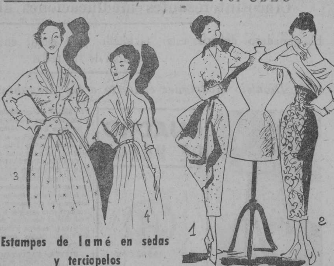
Estampes de lamé en sedas y terciopelos