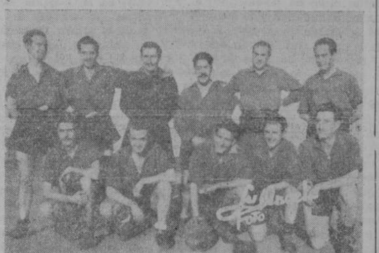
Selección de los funcionarios de la Audiencia