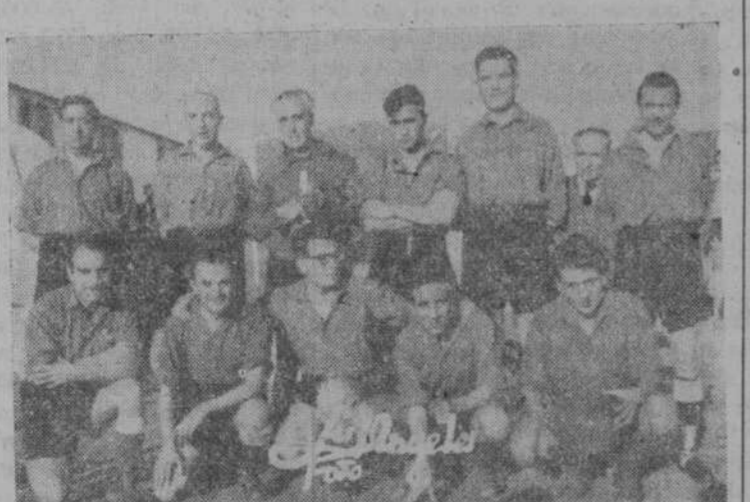
Selección de los funcionarios del Juzgado