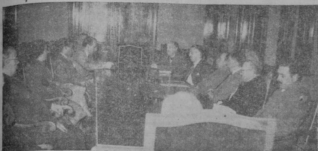
La Junta de la Campaña Pro-Navidad del Necesitado, durante su reunión.

Ayer, por la mañana, y en el salón de actos del Gobierno civil, se reunió, bajo la presidencia del excelentísimo y reverendísimo señor obispo de la diócesis y del excelentísimo señor gobernador civil, la Junta Coordinadora de la Campaña Pro-Navidad del Necesitado 1953, constituida por las siguientes autoridades y representaciones: