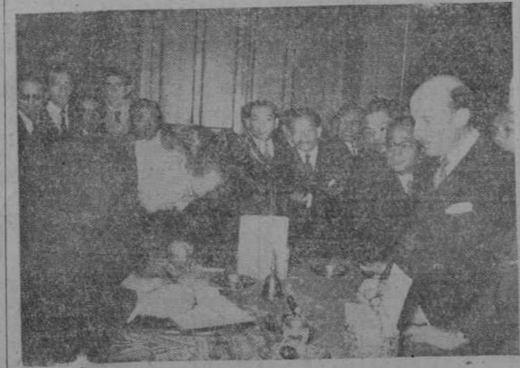
El ministro de Hacienda de Tailandia, Pravan Phamon Montu, firmando en el libro del Ayuntamiento, durante su visita con el grupo de parlamentarios.