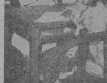
En la clase de costura

Prácticamente en nuestra provincia el analfabetismo no existe. A excepción de las comarcas del Rebollar (Ciudad Rodrigo) y en la Sierra alta, el analfabetismo ha sido vencido. Contra la proporción del diecisiete por ciento de analfabetos que existen en España, Salamanca da un dos por ciento, que se centraliza casi exclusivamente en el pueblo de El Payón, en el