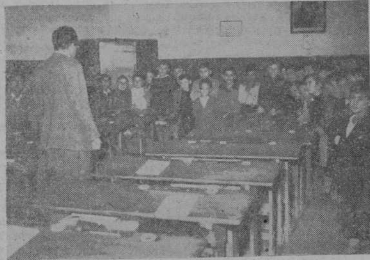
Los niños en uno de los grados escuchan las lecciones de geografía

El curso escolar ha comenzado y nuestro paso por las calles se ve entorpecido frecuentemente por la avalancha de chavales que corren presurosos a las escuelas a recibir las enseñanzas que han de ser los verdaderos cimientos para la grandeza espiritual de la nación.