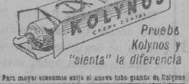
Prueba Kolyinos y "sienta" la diferencia