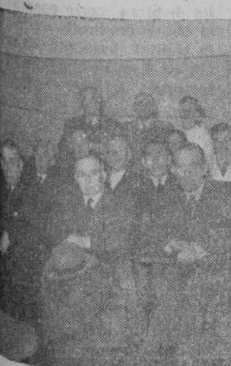
En el aula, los médicos asisten a una sesión de proyecciones sobre los temas tratados en la jornada