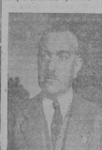
CONDE DE VALLELLANO

no necesitaba mayor explicación el contenido del proyecto sobre carreteras de peaje después de las palabras pronunciadas por el señor Peña, pero que estimaba oportuno aclarar que el Estado no puede resolver por sí sólo el problema de las carreteras.