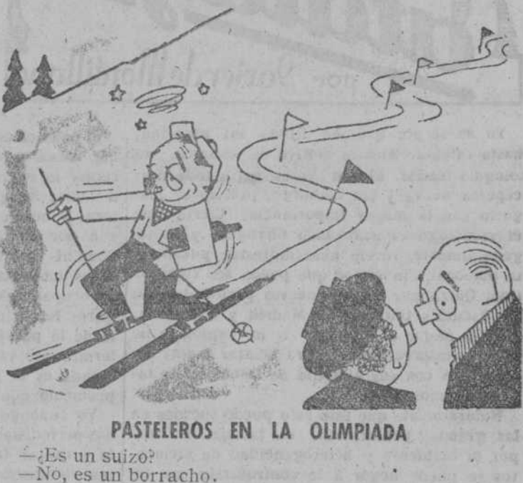
PASTELEROS EN LA OLIMPIADA