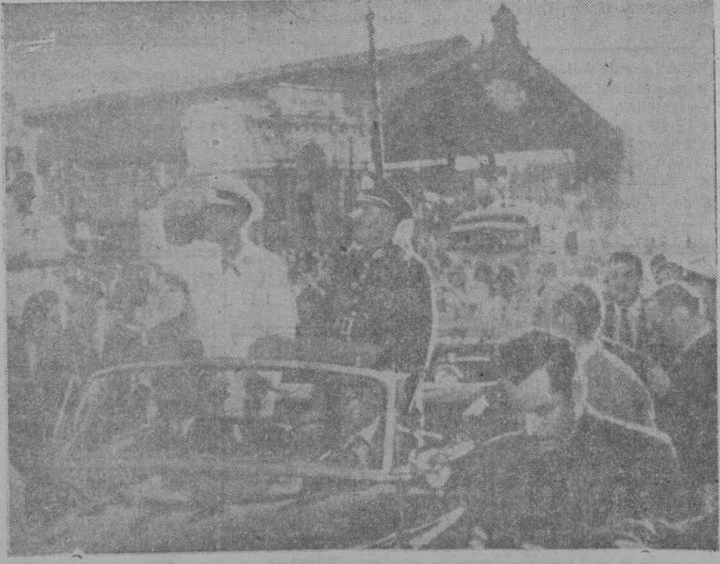
El general Perón, acompañado por el general Ibáñez, a su entrada en Santiago de Chile, donde fue calurosamente aclamado por el pueblo