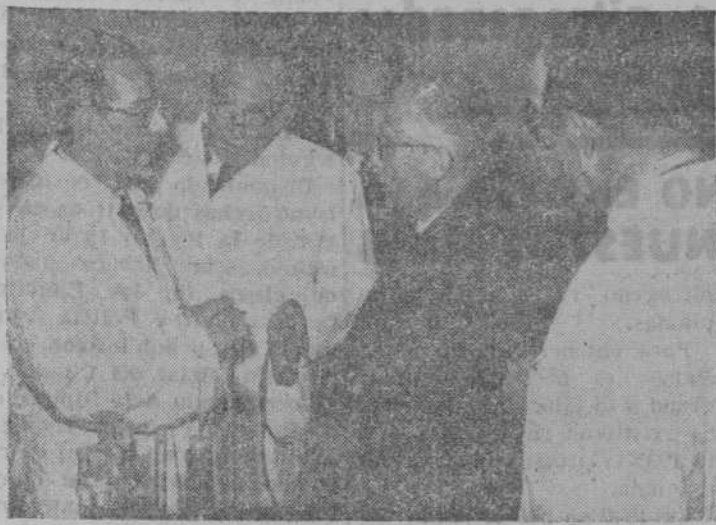
Entre las conferencias y lecciones prácticas se producen estas tertulias, en que prosiguen las consultas de detalle y los cambios de impresiones