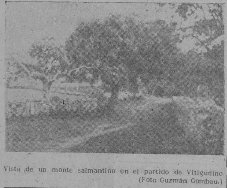
Vista de un monte salmantino en el partido de Vitigudino.

Vea usted, lector amigo, este dibujo. Algo hay en él que puede hacer a la sonrisa. Pero como a nosotros se nos ha perdido su "pie" humorístico, se nos ocurre que sea usted quien nos ayude a buscarle la gracia; la gra ya española, aunque el dibujo sea francés. Recorte, pues, este dibujo; péguelo en una cuartilla, y escriba debajo lo que a usted se le ocurra. Estamos seguros de que le encontrará la "gracia". Y nosotros correspondiéremos a su prueba de ingenio con un hermoso billete de CINCO DUROS. El plazo de admisión de pies para este dibujo se cerrará el próximo miércoles, día 18, a las ocho de la noche. Nuestra Redacción, en pleno, reunida en serio tribunal, adjudicará el premio, que, en ningún caso, quedará desierto. No se trata de un rompe cabezas Tenemos ya en nuestro poder muchos "pies"—bastante graciosos—para este dibujo. Y hemos de aclarar, para algunos concursantes que no han entendido bien nuestro propósito, que no se trata de buscar un pie, a modo de rompecabezas, sino de crear, de inventar, de escribir una frase o un diálogo que cuadren, con ingenio, a lo que el dibujo representa. ¿Enterados? Pues ¡vengan chistes!