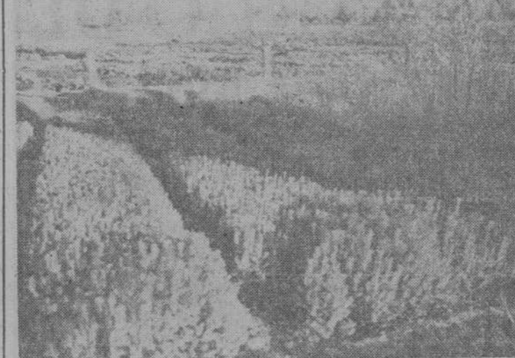
Aspecto de un vivero forestal en nuestra provincia.

Se ha podido observar, que el particular prestar singular atención a esta labor y ello queda reflejado en la petición