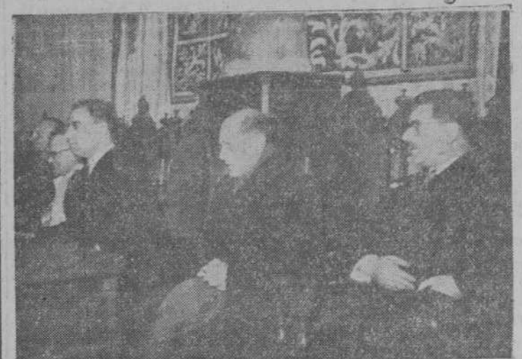
Presidencia del acto de apertura del Curso de Filología hispánica.

Terminó el señor Carreter dirigiendo en saludo a los nuevos cursillistas y haciendo votos por que se lleven un grato recuerdo de su estancia en Salamanca. LECCION DE DON ANTONIO TOVAR A continuación el rector de la Universidad, don Antonio Tovar, subió a la tribuna para pronunciar la primera lección oficial del curso. Versó