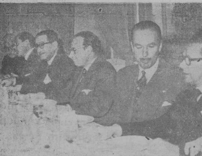
Presidencia de la comida celebrada ayer por la Asociación de la Prensa en honor de sus protectores y cuadro médico.

Especialista de aparato digestivo. Medicina y Cirugía de Estómago. Intestino, Hígado, Páncreas. RAYOS X. Consulta 11 a 1 y 5 a 6. Corrales de Monroy, 3. Tel. 2086. C. S. n.º 10