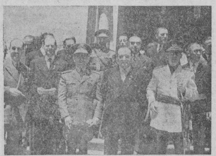
Las autoridades al salir de la misa solemne del templo de San Juan de Sahagún

A la izquierda se situó la presidencia civil, que integraban en-