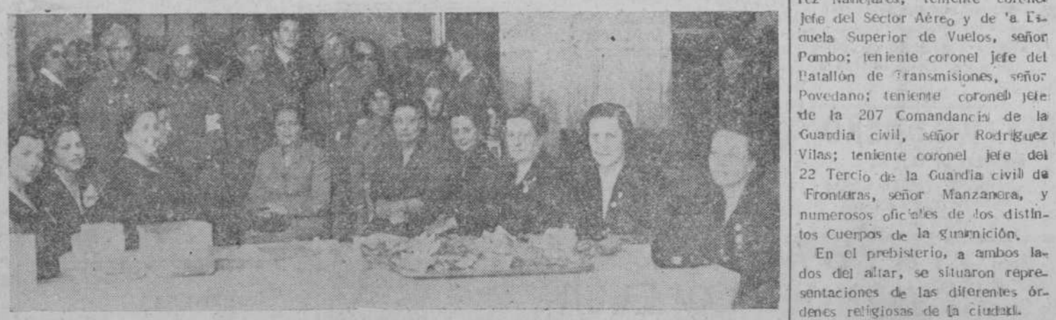
Las damas de la Cruz Roja presidiendo la mesa instalada en la Plaza Mayor, en la que, como en todas, los salmantinos hicieron patente su amor a tan benemérita institución