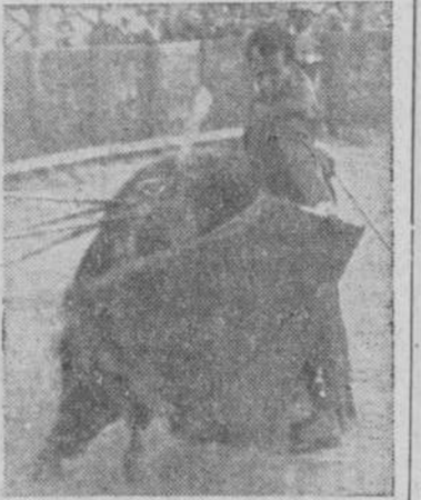
Luis Miguel Domingúin