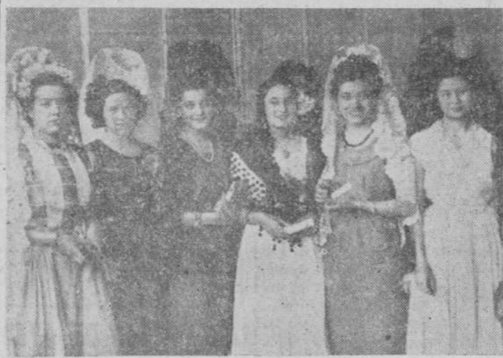
Las bellas presidentas del festival

Doctor RIVERA Especialista de aparato digestivo. Medicina y Cirugía del Estomago, Intestino, Hígado, Páncreas. RAYOS X. Consulta 11 a 1 y 5 a 6. Corrales de Monroy, 3. Tel. 2086. C. S. n.º 10