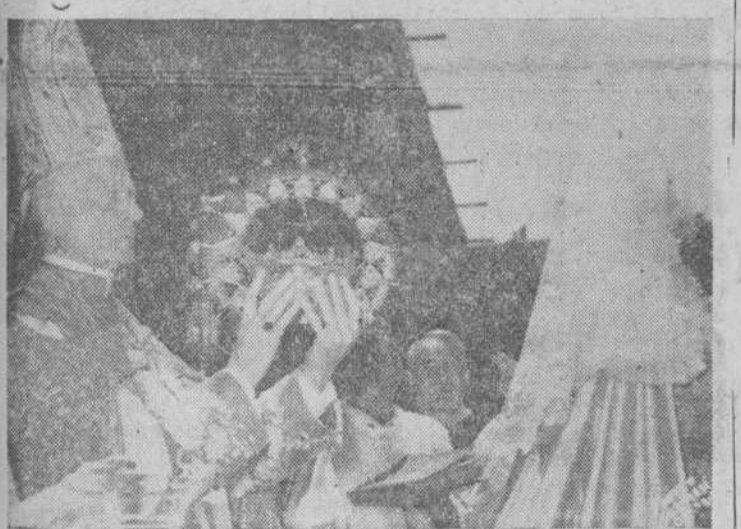
El cardenal Tedeschini en el momento de coronar canónicamente a la imagen de Nuestra Señora de Peña de Francia.

Terminada la misa, el cardenal Tedeschini pronunció un discurso a través de los micrófonos. En el recogió la profunda emoción y significado del acto. Exaltó el simbolismo de la Virgen de Peña de Francia, Virgen de la Peña, como en otros lugares del mundo católico se veneran también imágenes de Nuestra Señora aparecida sobre la dura roca. Piedra angular de la devoción católica, del cristianismo, es esta manifestación de fe ardiente que se traduce en amor y alabanza a Jesús Sacramentado, porque la devoción y el amor a la Virgen son premisas de una entrega total a los principios de nuestra religión. La Virgen de la Peña de Francia es —dijo— como la Virgen de Loreto en Italia y la Virgen de Lourdes en Francia, la exaltación del amor mariano, el espíritu católico y cristiano de los tres pueblos latinos que más se han distinguido por su fe y su defensa de la religión. Monseñor Tedeschini, vivamente emocionado, destacó aquel simbolismo que supone la entraña de la fe ardiente del pueblo salmantino, y con palabras casi veladas por la extraordinaria fuerza del momento, mostró a la multitud el rosario que Su Santidad Pío XII le entregó al partir hacia España para que lo depositara ante la imagen de Nuestra Señora de Peña de Francia. La multitud prorrumpió en ese instante en grandes vitores al Papa. Terminó el cardenal Tedeschini exaltando el amor hacia la Virgen y pidiendo a todos que esta pasión devota y filial se mantenga viva a través de los tiempos.